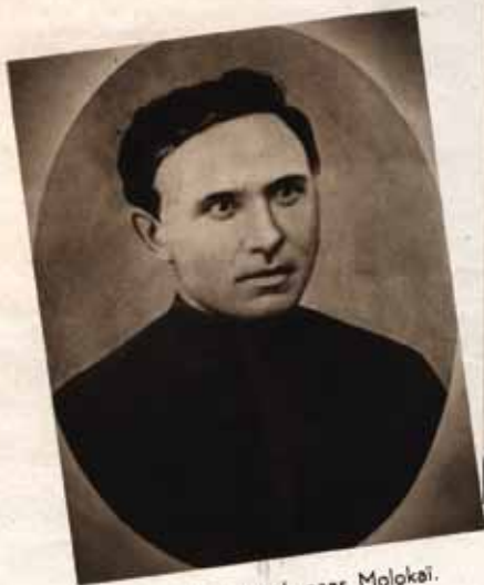
Vóór zijn vertrek naar Molokai.