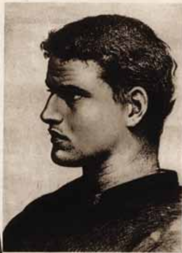
Pater Damiaan in 1868.