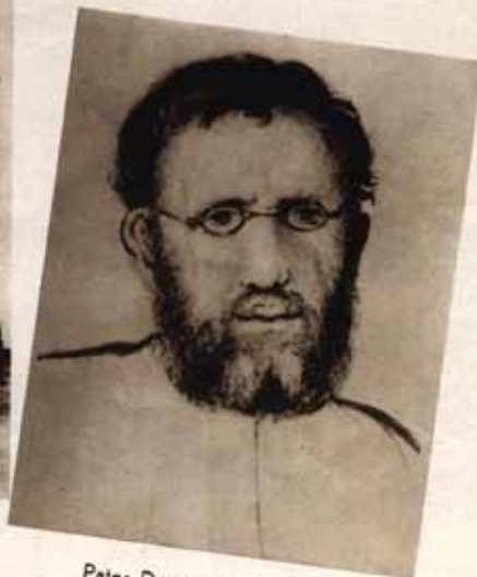
Pater Damiaan melaatsch.