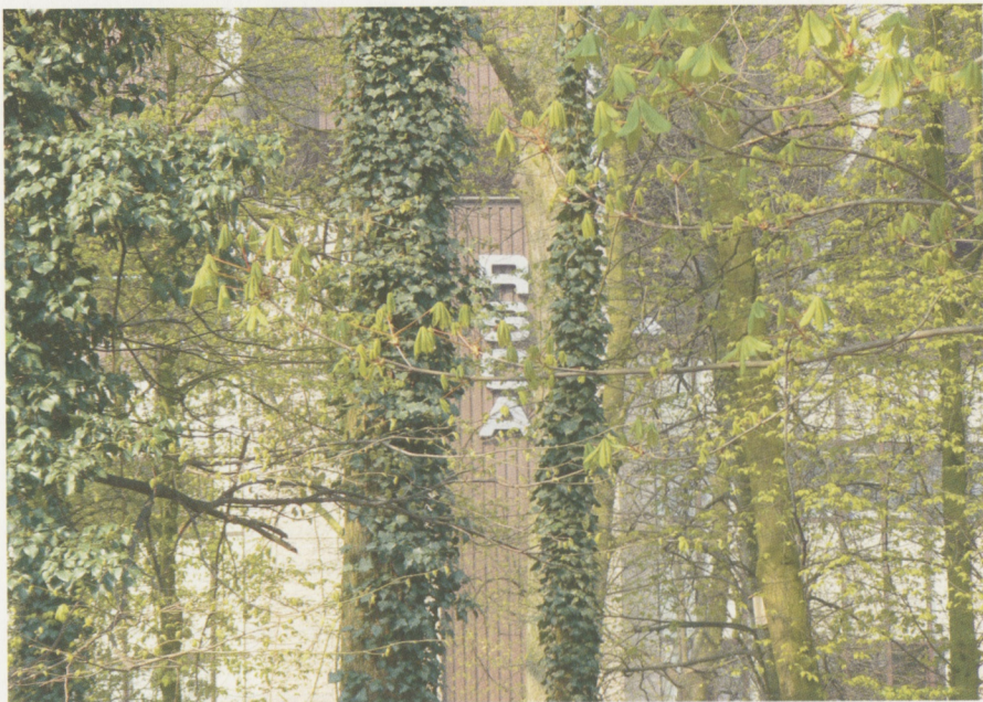
ASTRIDPARK MET UITZICHT OP HET STADION VAN ANDERLECHT

Nu is voetbal wereldwijd de populairste sport bij jong en oud. Toch is deze sporttak nog redelijk jong. Engelse bronnen maken er al melding van in de zestiende eeuw, maar pas midden negentiende eeuw bereikte het balspel het Europese vasteland. In België introduceerden vooral de zonen van goeude Britse inwijkelingen de sport, dikwijls via colleges of andere eerbiedwaardige onderwijsinstellingen. Vrouwen kwamen er in het begin niet aan te pas.