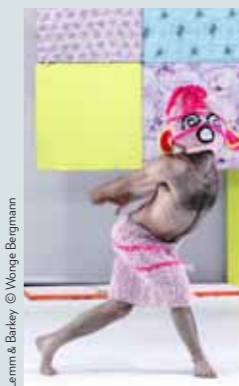
Lamm & Bailey © Wéngé Bergmann

Info: www.superbodies.be . Loopt van 4 februari tot 27 mei, gesloten op maandag, gratis toegang. De tentoonstelling in Z33 en CIAP lopen maar tot 13 mei.